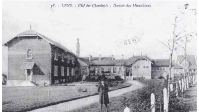
▲ Le foyer s'intégrait parfaitement dans le paysage de la cité. Il alliait fonctionnalité et solidité, répondant aux besoins d'une population ouvrière structurée autour du rail et des activités industrielles du bassin lensois.

Le foyer des roulants est resté ancré dans la mémoire collective. De nombreux habitants évoquent encore "le foyer" comme un repère du quartier, témoin d'une époque où la vie quotidienne était rythmée par le passage des trains et les métiers du rail. Sa présence, jusqu'à récemment, rappelait l'importance de la communauté cheminote dans l'histoire d'Avion.