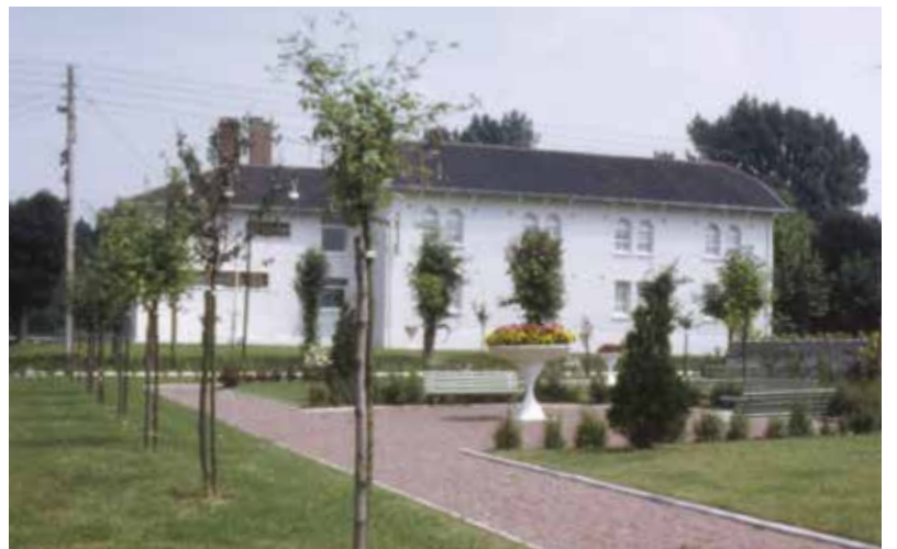
▲ Dortoir/foyer, mécaniciens/roulants, le bâtiment a connu bons nombres d'appellations mais il restera gravé dans la mémoire collective. ( photo 1969-cité des Cheminots. Lens )