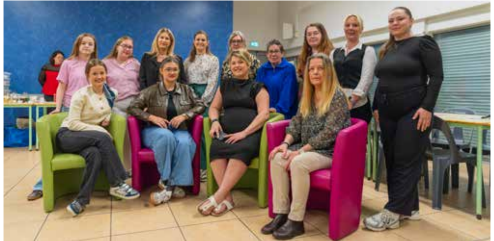
▲ La soirée des femmes à la Maison des habitants