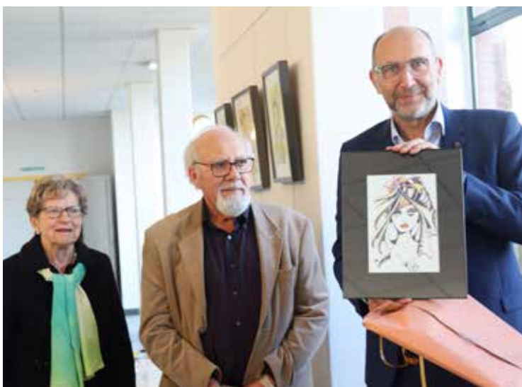
▲ L'exposition "Portraits de femmes" de Raoul Csizmadia. ► Le concert de Michèle Bernard.