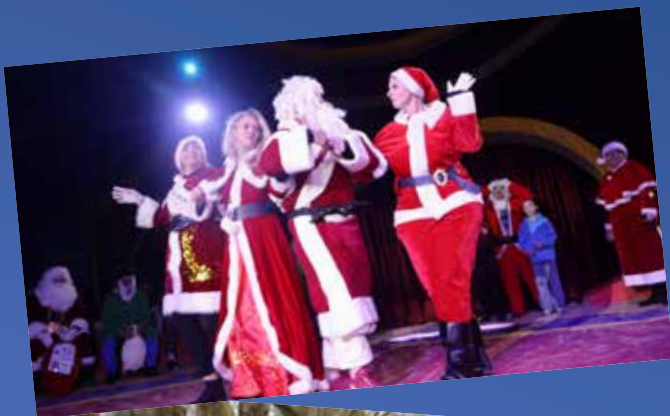
◀ Soirée des associations, Étoile ballet comédie grand gagnant du défilé en habit de Père Noël.