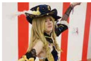
LA FÊTE DU MANGA