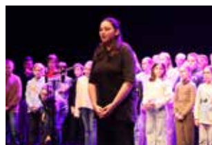
120 ANS DE LA LAÏCITÉ

AVION A CÉLÉBRÉ LA LOI DU 9 DÉCEMBRE 1905