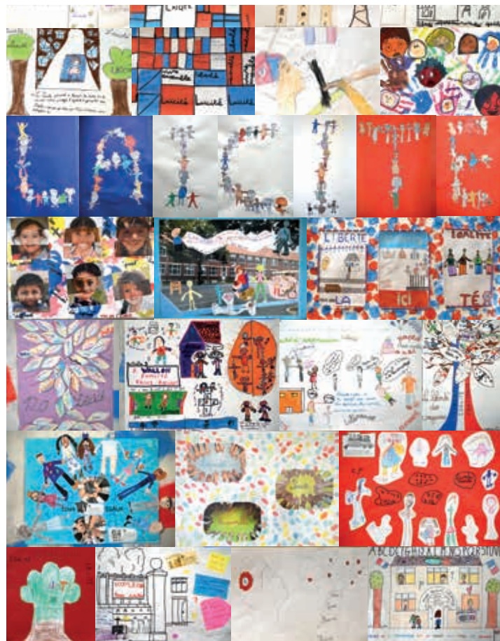
▲ Les dessins ont été réalisés par les élèves des écoles : Mandela-Rolland, Anne Franck, Louise Michel, Aragon-Triolet, Desnos-Casanova, Cachin, Lurcat, Wallon et Cadras.