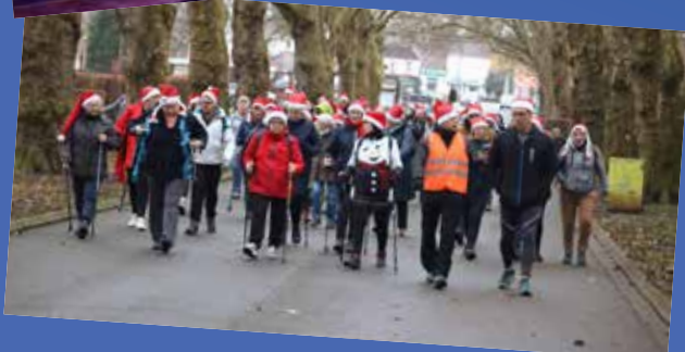
◀ Une marche des pères Noël était organisée le dimanche matin