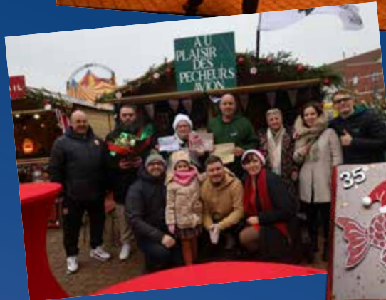
◀ Au plaisir des pêcheurs : Lauréat du plus beau chalet et de la plus belle carte d'anniversaire