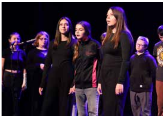
▲ Un spectacle salle Aragon réunissant les collégiens de Rousseau, Langevin et des lycéens de Picasso.