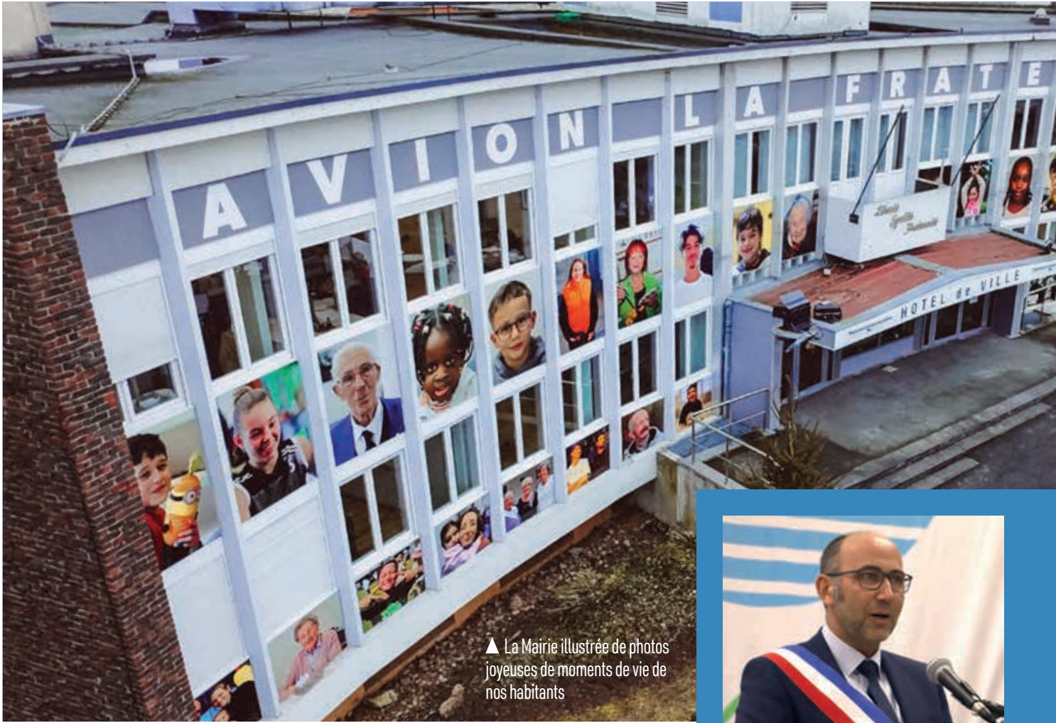
▲ La Mairie illustrée de photos joyeuses de moments de vie de nos habitants