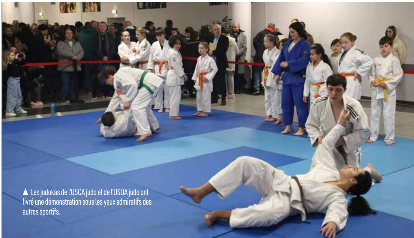
▲ Les judokas de l'USCA judo et de l'USOA judo ont livré une démonstration sous les yeux admiratifs des autres sportifs.