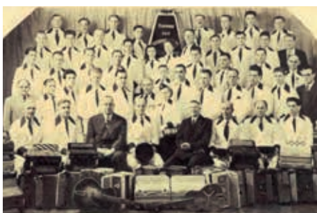
▲ Photo officielle avant le 6 e concours