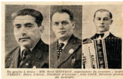
▲ Les visionnaires

En 1946, la municipalité relance le concours avec succès, malgré les difficultés d'héber-