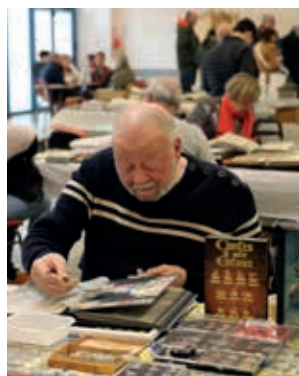
▲ La relève est assurée