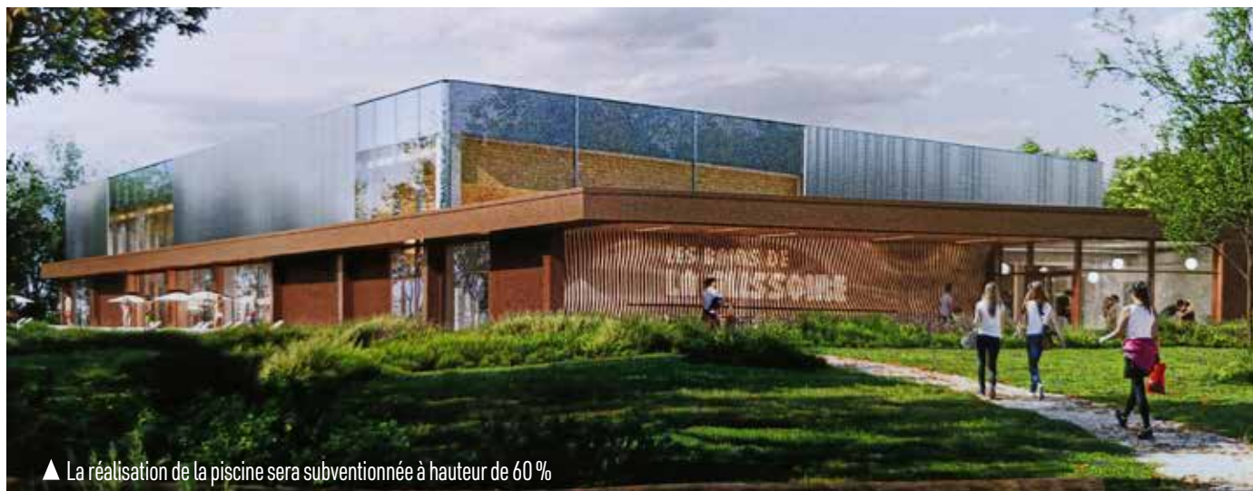
▲ La réalisation de la piscine sera subventionnée à hauteur de 60 %