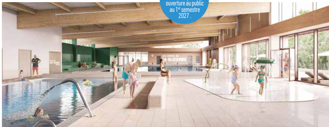
▲ Le centre aquatique bénéficiera de panneaux photovoltaïques et sera relié au réseau de chaleur.

Les travaux devraient débuter en octobre pour une ouverture au public au 1 er semestre 2027.