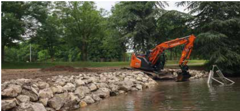
▲ 500 tonnes de roches contribueront à stabiliser 320 mètres linéaires de berges

Les promeneurs du Parc de la Glissoire assistent depuis quelques jours à un vaste chantier d'enrochement. Cette nouvelle zone propice à la biodiversité enjolivera l'espace et laissera la nature s'y exprimer !