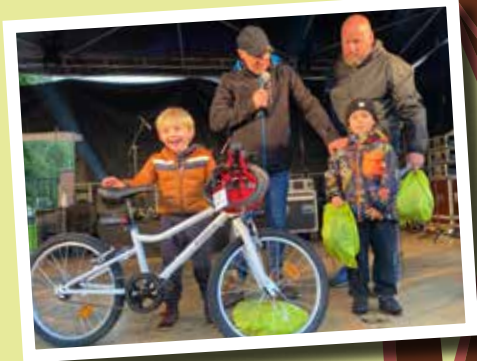
▲ Le grand gagnant du concours de vélo fleuri s'est vu offrir un beau vélo!