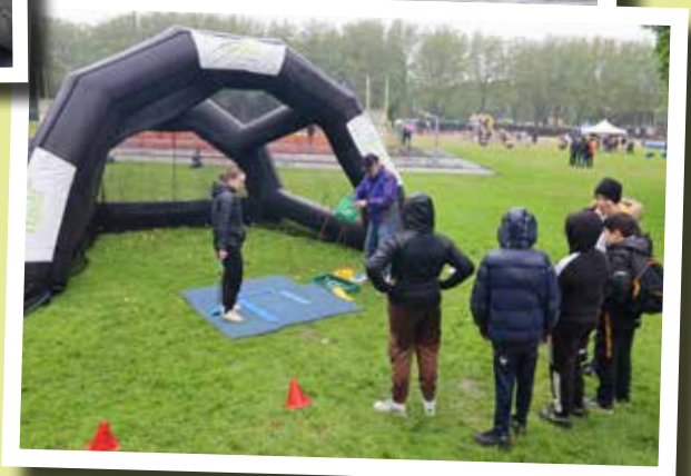
▲ Le défi de la Glissoire a offert de bonnes parties de rigolade et de l'initiation sportive grâce aux associations et services municipaux