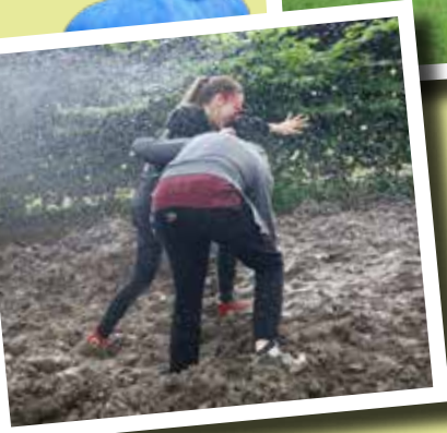
▲ La pluie a rajouté un peu de piquant (et de boue) à l'incroyable parcours de la Marche Folle...!