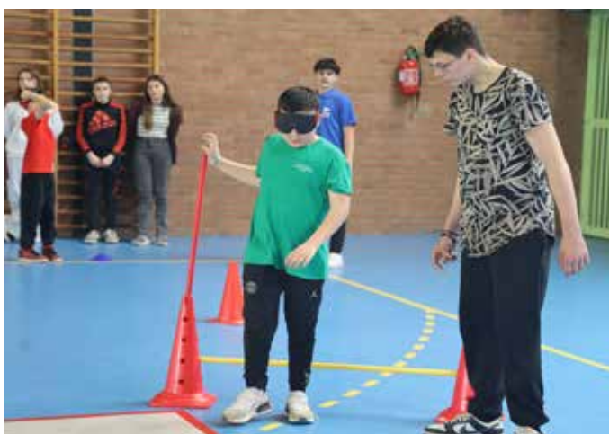
▲ Le Centre d'animation jeunesse a mené avec brio une action sur le handicap au cours de laquelle les jeunes avionnais ont dû « se mettre à la place ».

Les petits avionnais ont ouvert la voie aux plus grands. Il n'y a plus qu'à passer le témoin. Nous aurons l'occasion d'y revenir plus longuement car le thème de l'été aux accueils de loisirs sera consacré aux Jeux Olympiques et Paralympiques.