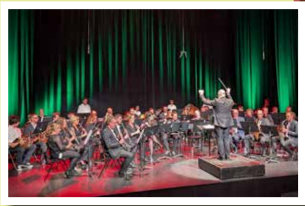
▲ L'Harmonie Municipale Ouvrière a ouvert et clôturé ce week-end festif en beauté avec deux magnifiques concerts!