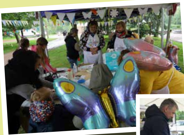
Les services municipaux ont proposé le plein d'activités pour s'amuser et découvrir dans une vingtaine de stands tout autour du parc !