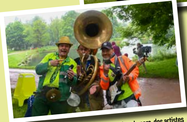
▲ Pour maintenir une ambiance festive dans le parc, des artistes sont venus à la rencontre des visiteurs !