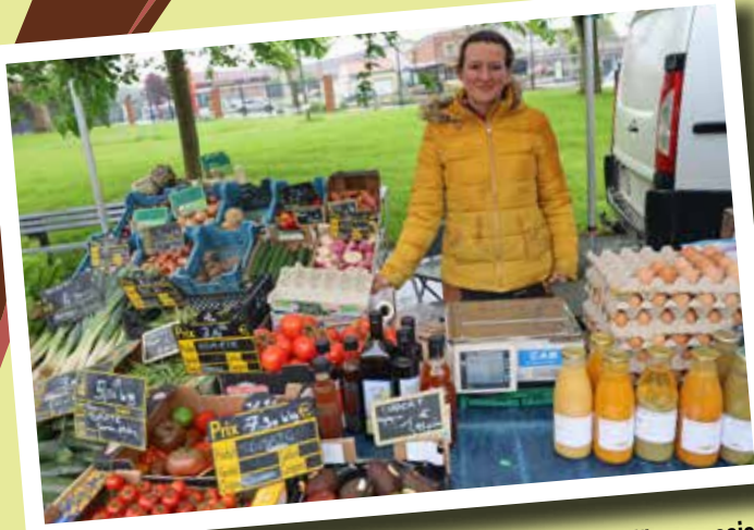
▲ Au Jardin Public, les producteurs locaux du "Panier Local" proposaient de délicieux produits frais et de qualité