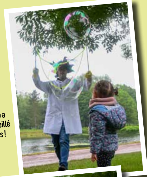
► Monsieur Bulle a initié et émerveillé petits et grands !