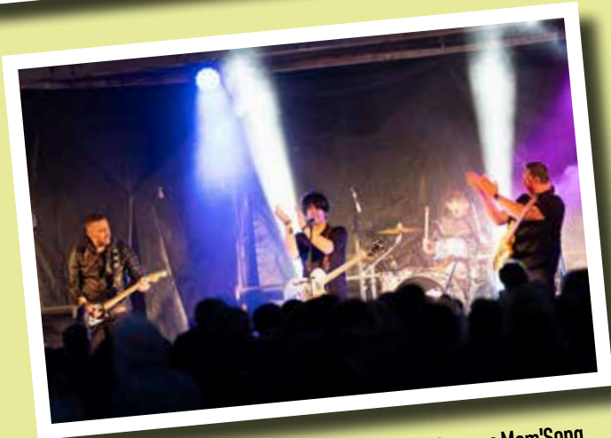
La scène musicale a réchauffé les cœurs des petits avec Mom'Song et des grands avec l'excellent Tribute d'Indochine : Black City, pour enfin laisser place au feu d'artifice au Jardin Public!