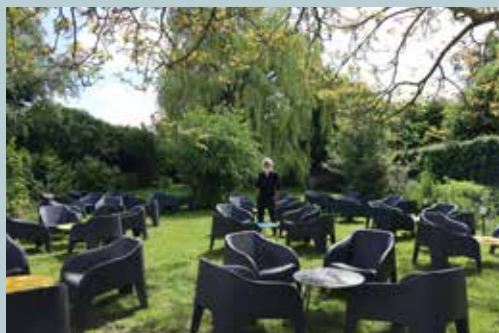
213, boulevard Henri-Martel, à Avion