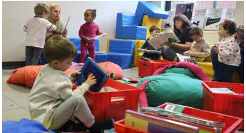
▲ Les tout-petits encadrés par les assistantes maternelles ont profité de ce temps d'accueil dans la salle de l'heure du conte pour découvrir une sélection d'albums sur le thème du sommeil avec « Au lit, petit lapin ! », « Une histoire de dodos », « Un câlin », « Au lit, petite souris » ...

La médiathèque et le Relais Petite Enfance tissent des liens pour permettre aux enfants de 0 à 3 ans de bénéficier d'un accueil spécialisé dans des locaux adaptés.