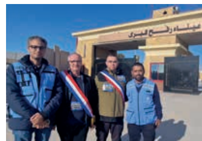
▲ Échange au poste frontière de Rafah avec les responsables de l'UNRWA (ONU)