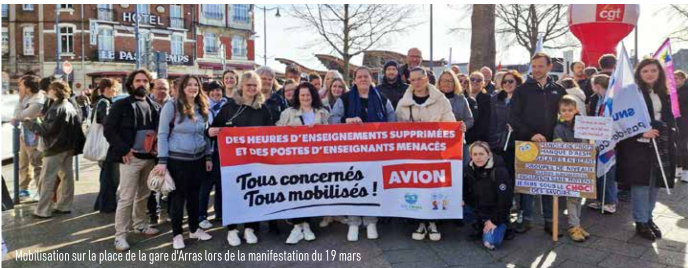
Mobilisation sur la place de la gare d'Arras lors de la manifestation du 19 mars

Parents, grands-parents d'élèves, enseignants : ils étaient plus de 120 à répondre à l'invitation de Monsieur Le Maire et venir assister à la réunion du 12 mars dernier, point de départ d'une forte mobilisation à Avion.