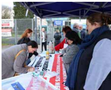
◀ Un stand pour la signature d'une pétition aux entrées des établissements scolaires.