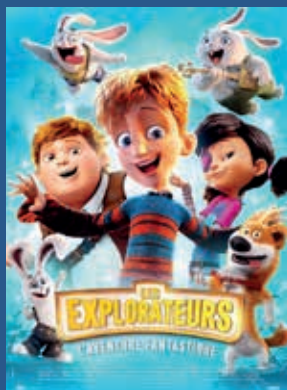
LES EXPLORATEURS : L'AVENTURE FANTASTIQUE (Durée 1H22) Film Jeune Public Mercredi 24 avril 14H30 Samedi 27 avril 14H30 Dimanche 28 avril 15H00 Lundi 29 avril 14H30