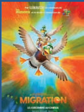
MIGRATION (Durée 1H22) Film Jeune Public Mercredi 10 avril 14H30 17H30 Samedi 13 avril 14H30 17H30 Dimanche 14 avril 15H00