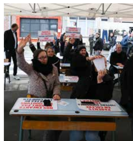
▲ Une classe était organisée sur le marché d'Avion.