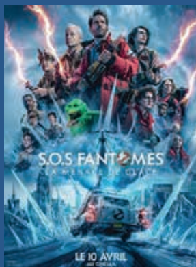
SOS FANTÔMES : LA MENACE DE GLACE (Durée 1H56) Film Tout Public Mercredi 24 avril 17H30 20H30 Samedi 27 avril 17H30 20H30 Dimanche 28 avril 17H00 Lundi 29 avril 17H30 20H30