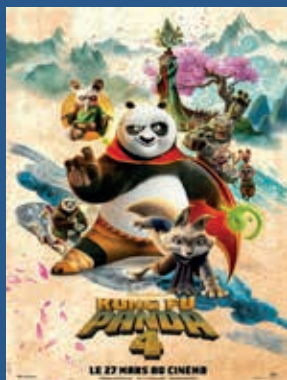
KUNG FU PANDA 4 (Durée 1H34) Film Jeune Public Mercredi 03 avril 17H30 Samedi 06 avril 14H30 17H30 Dimanche 07 avril 15H00