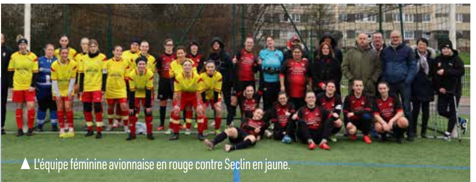
▲ L'équipe féminine avionnaise en rouge contre Seclin en jaune.