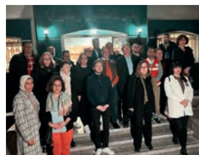
▲ Visite de l'hôpital de El Arich (Égypte) le plus proche de Gaza où sont soignés de nombreux blessés. Échange avec les enfants palestiniens.