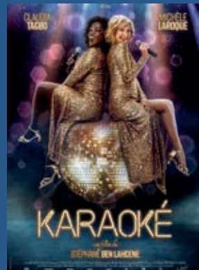
KARAOKE (Durée 1H29) Film Tout Public Mercredi 17 avril 14H30 17H30 Samedi 20 avril 17H30 20H30 Dimanche 21 avril 15H00 Lundi 22 avril 20H30