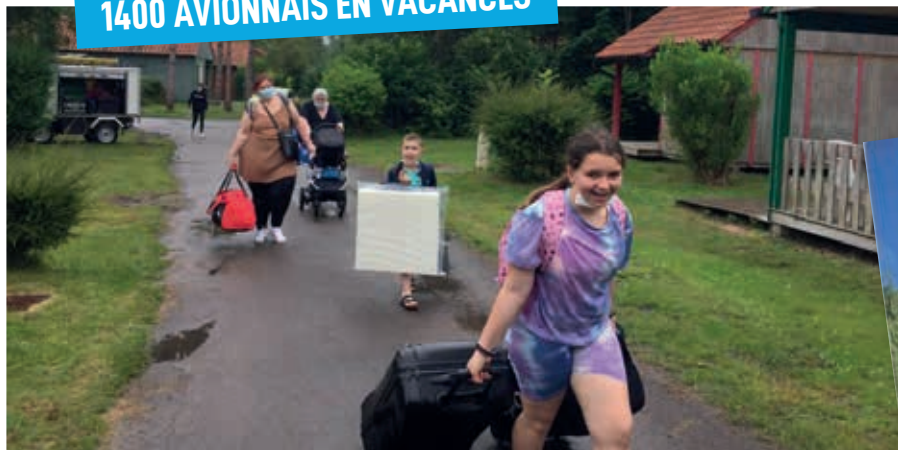
11 familles ont passé une semaine du 10 au 17 juillet à l'Orée du Bois, un camping 4 étoiles doté d'installations modernes, dans un site boisé proche de Berck-sur-Mer. Ils ont pu profiter de la piscine tous les jours et des navettes gratuites pour aller sur la plage ou en ville.