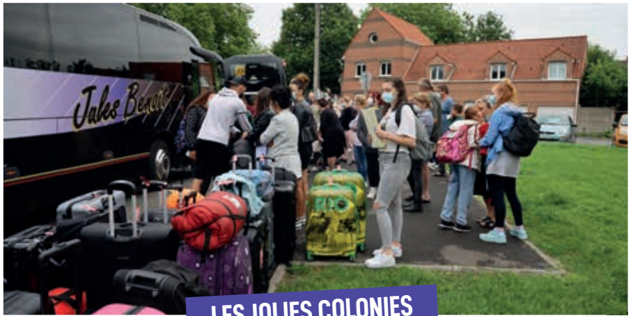
LES JOLIES COLONIES

H ors les autres initiatives (Sac' Ados, MERcredis de l'été, sortie à la mer...) ce sont 1462 avionnais (soit 7% de notre population) qui ont profité de l'opération « 1000 avionnais en vacances ». Ce succès s'est notamment matérialisé par de nombreuses cartes postales adressées par les familles bénéficiaires. En dépit de la crise sanitaire le mot « vacances » a pris tout son sens pour de nombreux foyers qui n'avaient pas les moyens d'en prendre. Ces petits mots ne sont pas que des morceaux de bonheur, c'est aussi la preuve que pour de nombreux Avionnais et Avionnaises, cet été fut synonyme d'évasion, ce dont nous avons tous besoin.