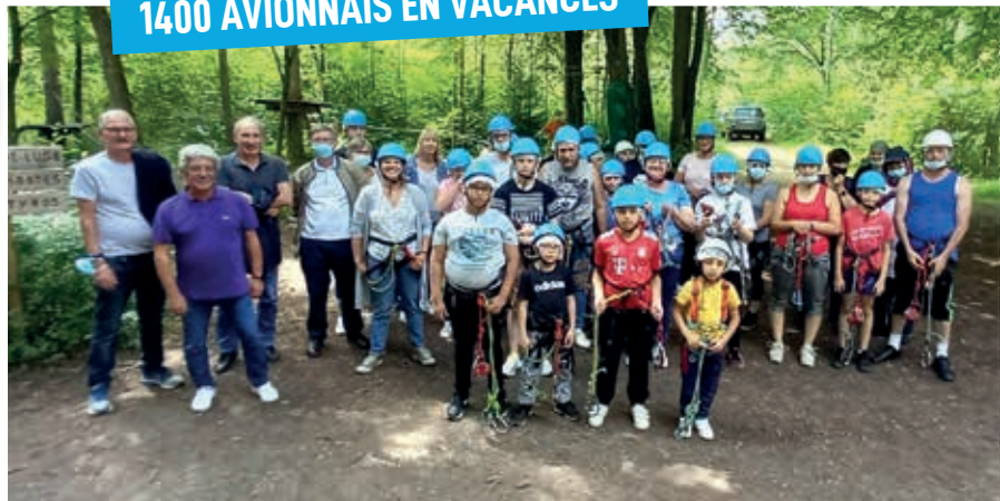
Venus sauver les estivants dans la forêt du parc Canopée d'Ambleny où des parcours d'accrobranche étaient organisés, les élus ont pu visiter le superbe gîte de Monampeuil.