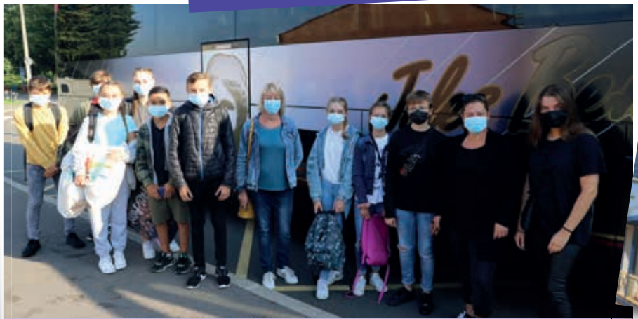
Direction La Bonneville-sur-Iton, en Normandie, pour quinze jours de colonie en camping. Un programme diversifié les attend, entre grand jeux et sortie à la mer... pas le temps de s'ennuyer. Au total, ce sont 49 enfants et adolescents qui seront partis au cours de ces deux mois en colonie de vacances.